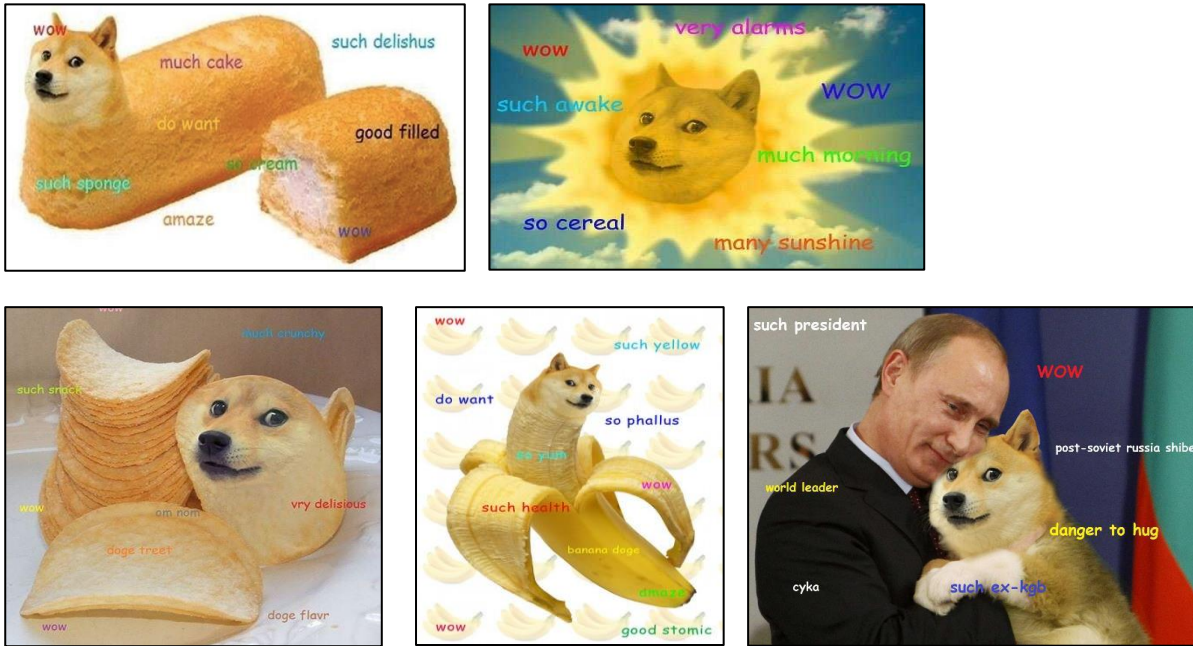
Şekil 3. İkonik Doge Meme Örnekleri

Netice olarak ortaya çıkan Doge temalı memlerin hayal gücünün sınırı olmayacağını kanıtlar niteleğindedir. Nitekim Doge, Şekil 3’te de görüldüğü üzere, her türlü sürreal biçime sokulmuş ve akla gelebilecek envai çeşit konuya bağlantı kurularak sıradışı görsel yakıştırmalar yapılmıştır. Söz konusu köpeğin bir kek formunda, bir çips şeklinde, bir muz halinde, Teletubbies’deki güneş bebek olarak veya Rusya Devlet Başkanı Vladimir Putin’in koynundaki köpek görüntüler ikonlaşmış Doge meme örnekleri olarak verebiliriz. Böylece Doge, 2010’ların en espirili ve başarılı İnternet memlerinden biri olarak tarihe geçmiştir (Knowyourmeme.com, 2021).