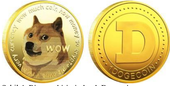
Şekil 4. Bir para birimi olarak Dogecoin

kripto para furyasının başlamasıyla birlikte hem Bitcoin'a alternatif olarak hem de takıntılı kripto para yatırımcılarla dalga geçmek adına bir internet memine dayalı bir şaka olarak ortaya çıkmıştır. Başka bir ifadeyle Dogecoin , bir parodi olarak icat edilmiş olup, resmî olarak 6 Aralık 2013 yılında tanıtılmış ve böylece piyasaya sürülmüş ilk “şaka para” birimi olmuştur (Frankenfield, 2021).