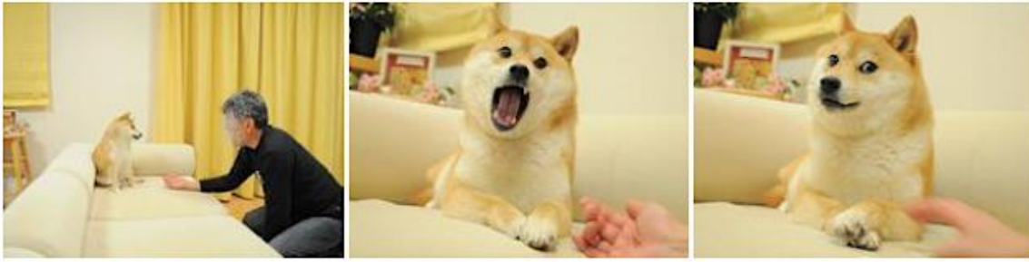
Şekil 2: Orijinal Shiba Inu Köpeği Kabosu