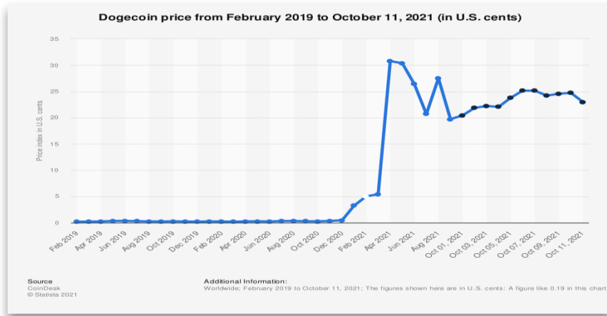
Şekil 5. Dogecoin Fiyatlarının gelişimi (Şubat 2019 – Ekim 2021)

Dogecoin , herhangi bir ulustan veya devletten fiziksel bir desteği olmayan, bunun yerine blokzincir teknoloji ile bir çok bilgisayara dağıtılmış bir dijital ağ üzerinde tutulan, sahtecilik ve diğer manipülasyonları önlemek amacıyla kriptografi ile güvenceye alınmış bağımsız kripto para birimi türünden büyük dijital defterlerdir (Biscontin, 2021). Şekil 5'te görüldüğü üzere Dogecoin fiyatları ve piyasa değeri 2021 yılının başlamasıyla büyük bir artış göstererek yaklaşık %1,500 yükselmiştir (Ponciano, 2021a). Ekim 2021 itibariyle kripto para piyasasında 10. sırada yer alan Dogecoin , toplam piyasa değeri 34 milyar dolar olarak işaret edilmektedir. Bu artışın Dogecoin 'in doğru ve güvenilir bir para birimi olduğunu göstermediğini, bu güvenin ve istikrarın oluşabilmesi için zamana ihtiyaç olduğunu söyleyebiliriz (Halkbank, 2021).